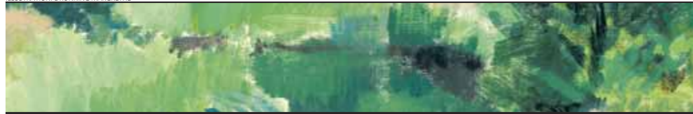
ILLUSTRATION: DRONNING MARGRETHE